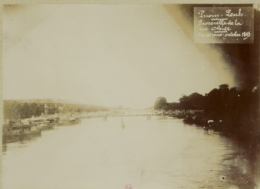
Tivoli - Lago Favonella de la me Chise 10.10.1903