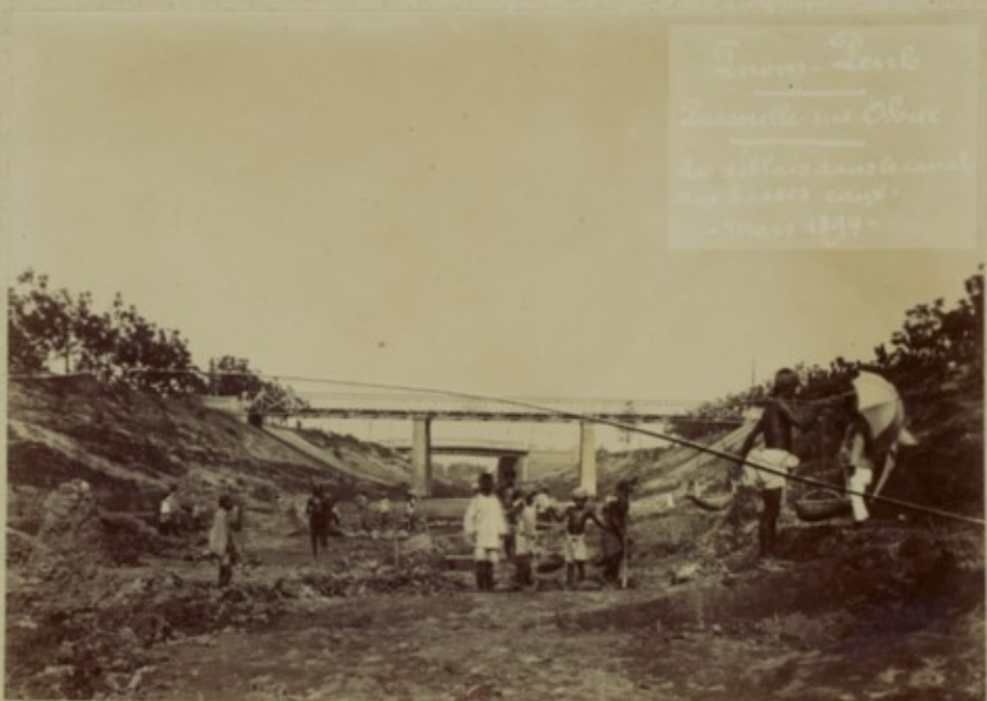
Innov. Level Zanesville vs Ohio the village canal the canal canal - May 1844 -