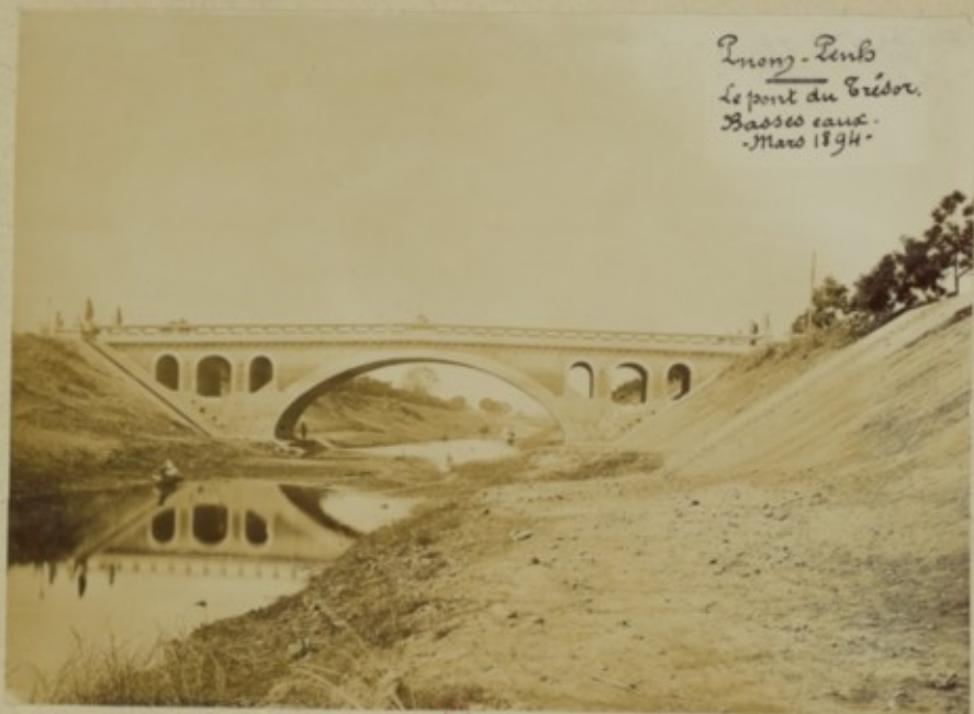
Imony - Benbo Le pont du Crédor. Basse eau. - Mars 1894 -