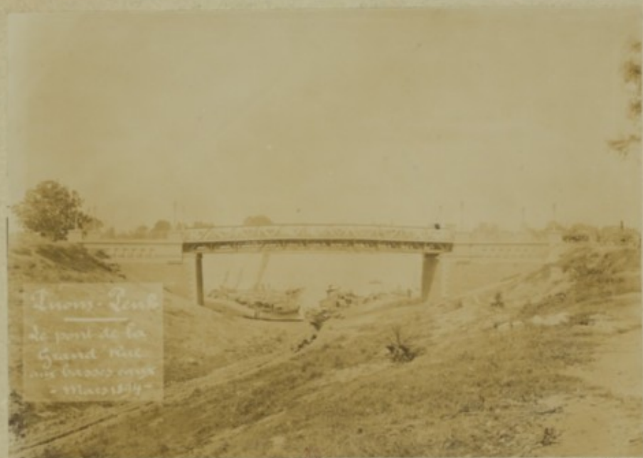
Le pont de la Grand' Mairie aux basses eaux - Mars 1874 -