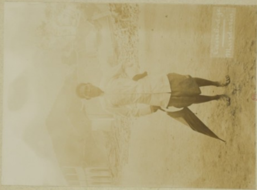
Feb 21 29