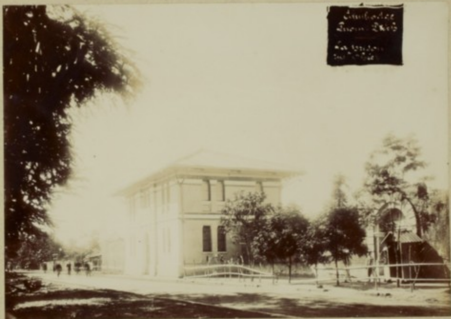
Cambodge. Inom-Penh. La Prison rue Obier. G 124231