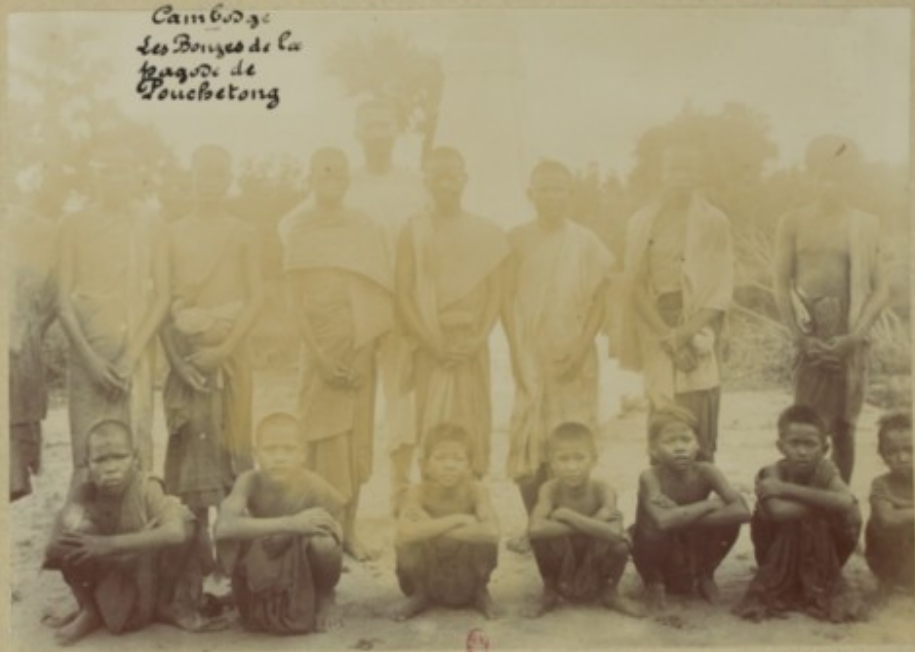
Cambodge Les Bouzes de la pagode de Pouchebong