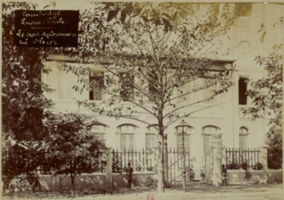
Cambodge.. Inom - Penh .. Le Port de Commerce.