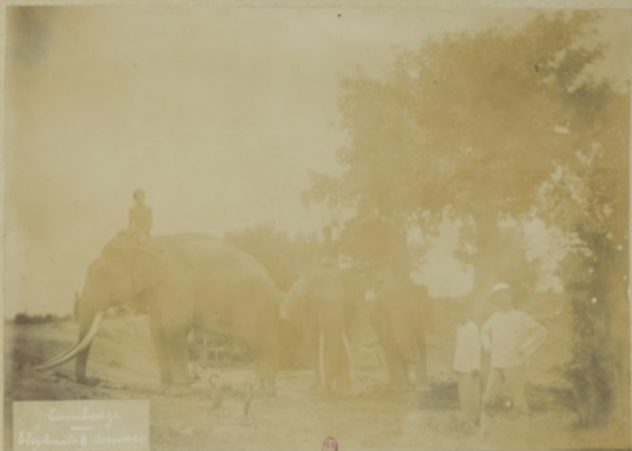
Cambodge Elephant's corner