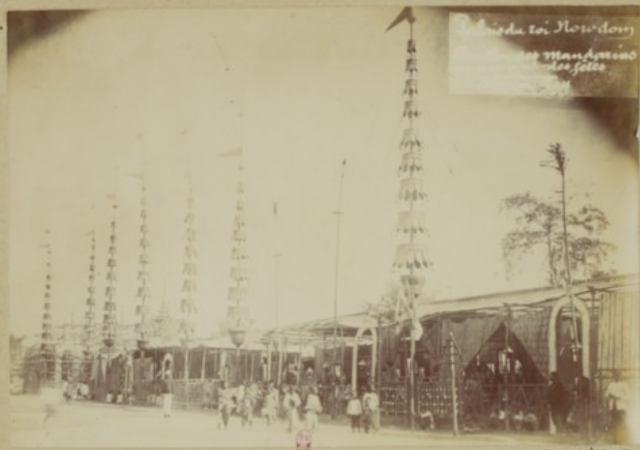
Shinjuku toi Now down Mansuemon Mansuemon