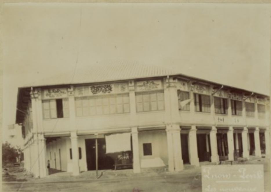
Tramway - Lorient des anciennes compartiments