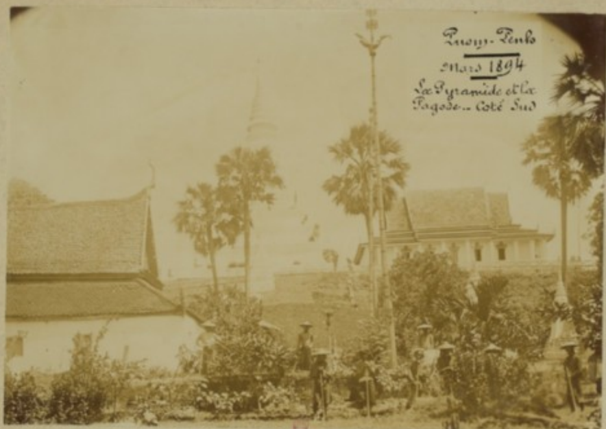
Luoyi-Tenbo Mars 1894 La Pyramide et la Pagode... Côté Sud