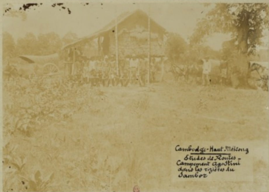
Cambodge-Haut-Mékong Etudes de Roules - Campement Agostini dans les rizières du Sambor