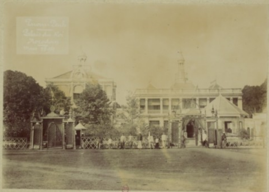
Trinity School School for the Deaf and Blind New York