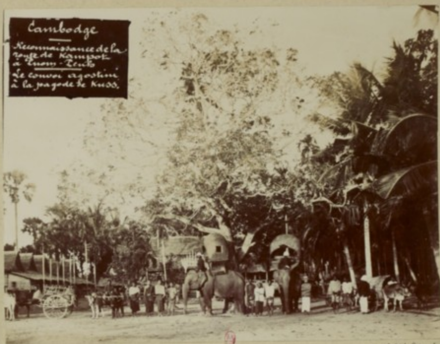
Cambodge Reconnaissance de la route de Kampong à Suong - Leuk Le Courrier argentin à la pagode de Kuo.