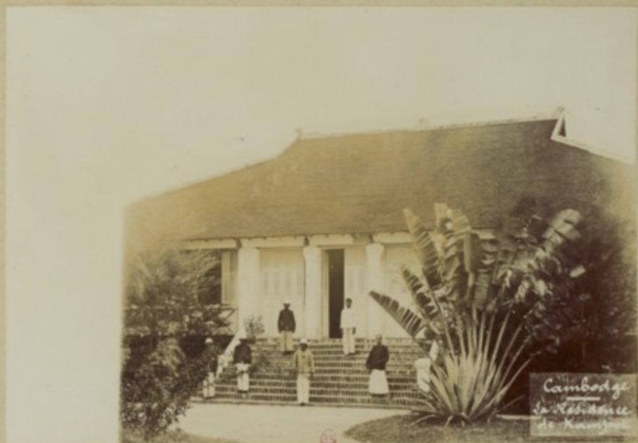
Cambodge La Résidence de M. de la Porte