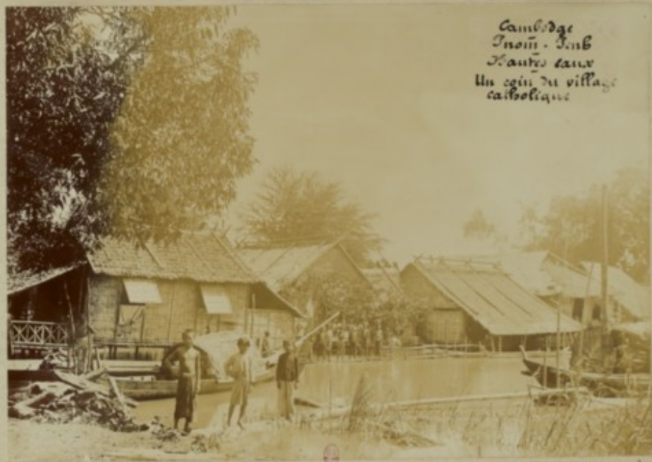
Cambodge Mouk - Samb Hautes eaux Un coin du village catholique