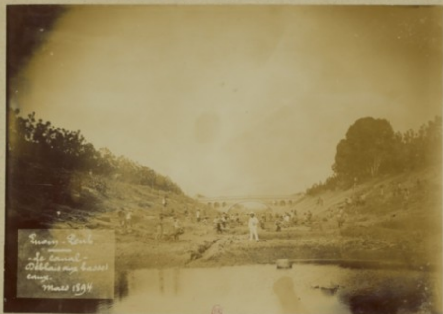
Quai - Canal - de Canal - Déblais aux basses eaux. Mars 1894