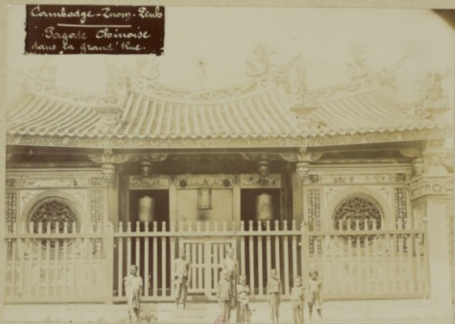
Cambridge - Inom - Sino Pagode Chinoise dans la grand' Rue.