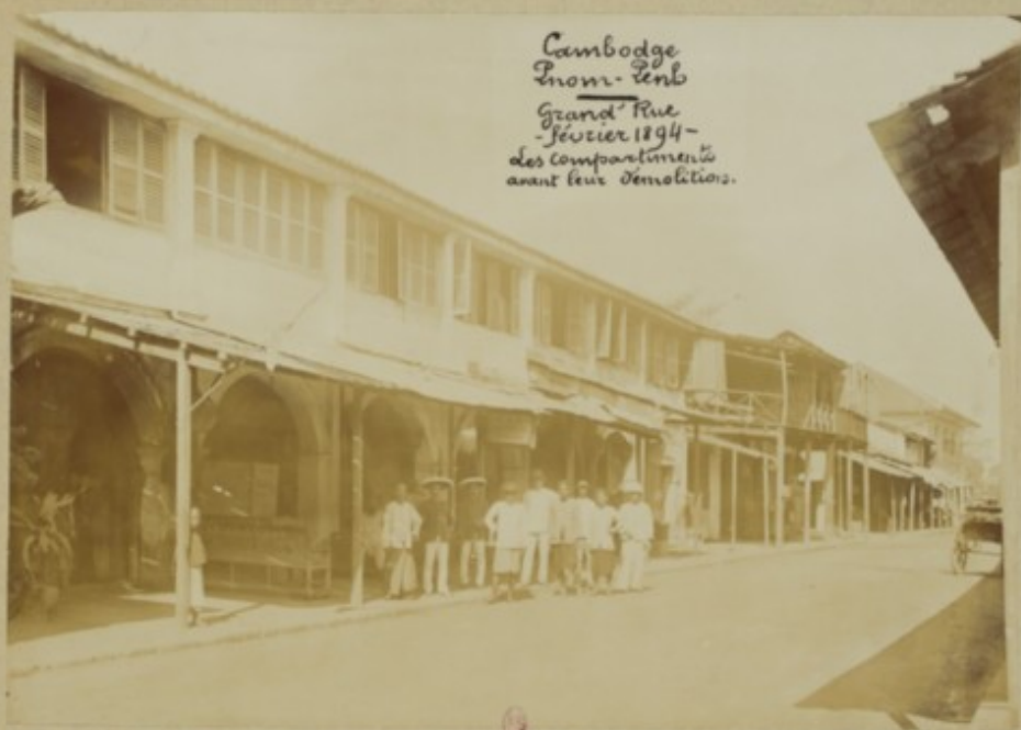
Cambodge Pnom-Penh Grand Rue février 1894 - des compartiments avant leur démolition.