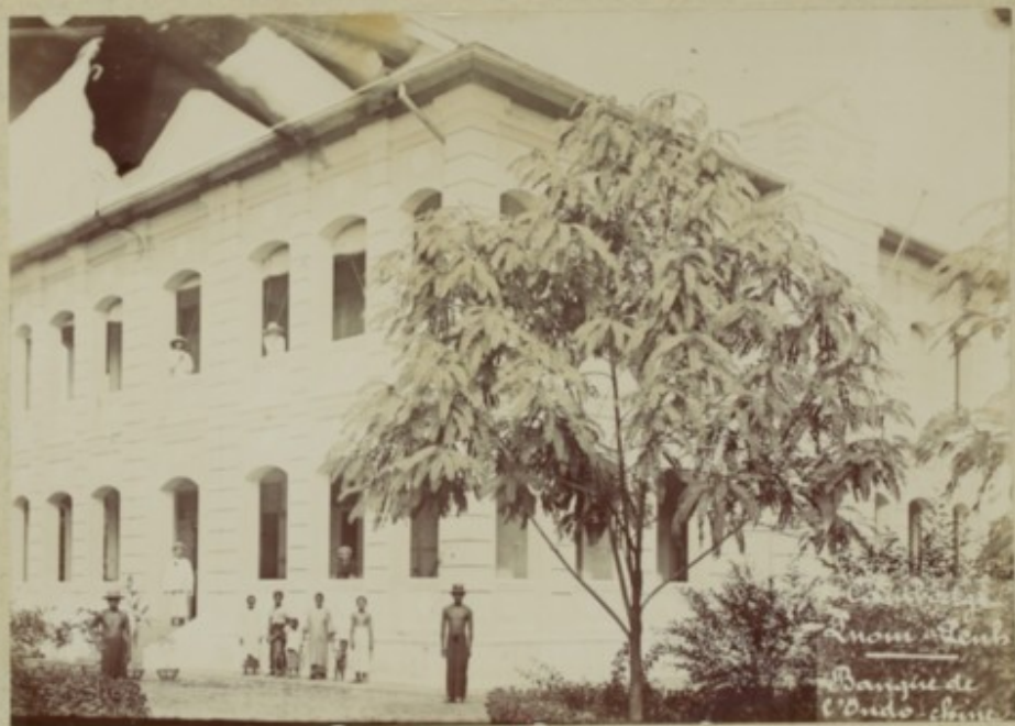
Monsieur Banque de l'Ono. chris