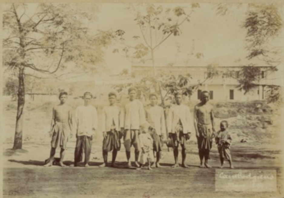
Carroll's group 1901