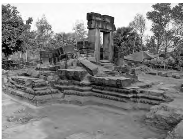
Photog 2 : Vestiges de la tour centrale du Prasat Tromoung après dégagement, vue du sud-est.

du temple sont relativement dégagés, les surfaces mises en cultures (rizières, légumes...) et la topographie environnante bien conservée 4 . De plus, un long canal creusé lors des travaux de remise en eau du Baray dans les années 40 passe juste à sud de l'enceinte du temple, coupant d'est en ouest tout le site (photo 1 et figure 2). Il fournit une opportunité exceptionnelle d'obtenir des sections stratigraphiques en rafraîchissant les coupes sur ses rives.