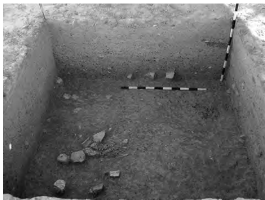
Photo 4 : Vue d'ensemble depuis le Nord des sondages 4 et 2 au travers le bassin nord-est.