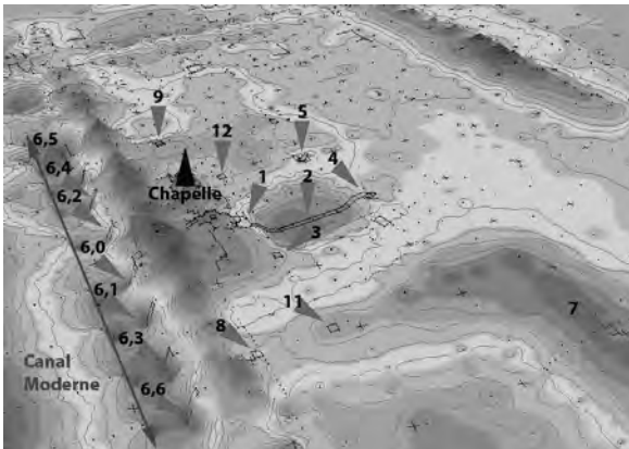
Figure 3 : Modélisation numérique de terrain et localisation des sondages au Prasat Tromoung.

Les opérations de fouilles ont consisté en l'ouverture de 19 sondages répartis sur une aire de 20000m 2 , en fonction de divers événements topographiques encore discernables actuellement (tertres, dépressions, etc.). Les sondages de la campagne 2006 ont été nommés de PTM1000 à PTM12000. Les 7 sondages de 2m de front fouillés dans la berge du canal moderne qui coupe le site au sud du temple, ont quant à eux été regroupés sous le label PTM6000 et distingués par la centaine, aucun de ces sondages n'ayant livré plus de 99 US (de 6000, 6100... à 6600). Seuls les chiffres des milliers sont utilisés dans le présent article pour désigner les sondages (de 1 à 12 ; figure 3). L'enregistrement des structures et des unités stratigraphiques (US) a été effectué par sondage, de 1 à x. Ainsi pour le sondage 1000, les US sont nommées 1001, 1002 etc... et pour le sondage 2000, elles sont numérotées 2001 et suivantes, aucun sondage n'ayant livré plus de 999 US.