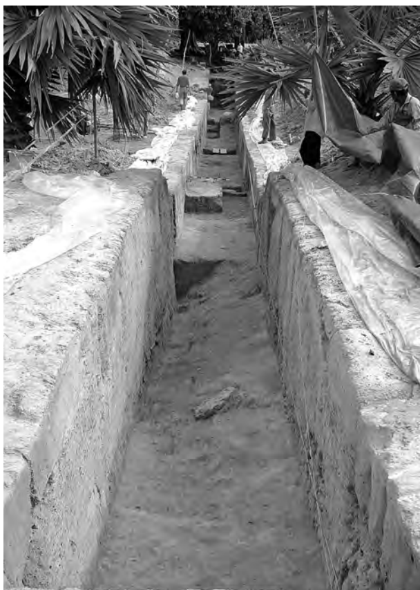
Photo 3 : Sondage 3, niveaux d'occupations avec moellons, tuiles, charbons (3008, 3009).

précoces à cette période de l'année), nécessitant un ombrage systématique des zones de fouilles et le bâchage de certains sondages la nuit. Le dégagement du temple, la découverte de tombes, et la complexité de la fouille du bassin ont entraîné l'extension des zones fouillées et une nette surcharge de travail. Compensée par le recrutement d'ouvriers supplémentaires et l'abnégation de l'équipe d'archéologues, la durée prévue de fouille n'a finalement été dépassée que d'une semaine.