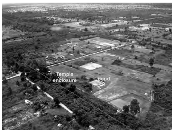
Photo 1 : Vue aérienne des environs du Prasat Tromoung en 2005, vue du sud-est.