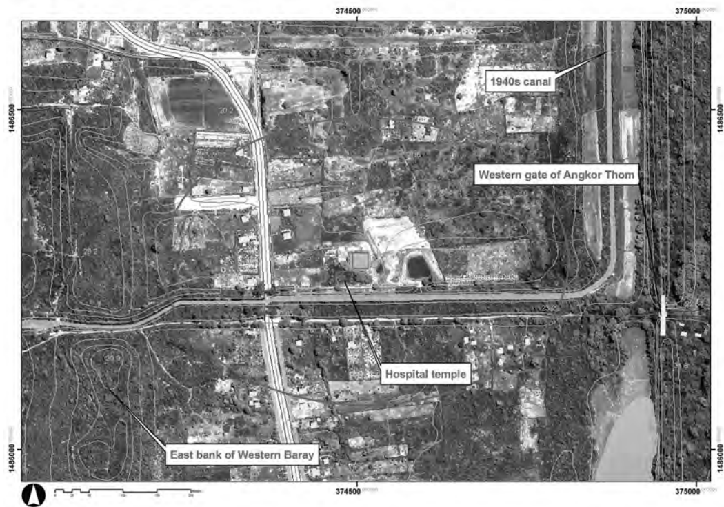
Figure 2 : Plan des environs du Prasat Tromoung.

Le Prasat Tromoung, l'hôpital occidental, est situé entre la douve occidentale d'Angkor Thom et le Baray occidental (photo 1 et figure 2). Depuis sa découverte en décembre 1925 par Léon Fombertaux et son dégagement de janvier à juillet 1926, cette chapelle n'a pas été perturbée, hormis par les pillages qui ont éventré sa tour centrale. Il demeure que le temple était déjà très largement ruiné, se résumant au sous-bassement de la tour centrale et de son cadre de porte, et à la base du gopura (photo 2). Le bassin au nord-est est encore sensible, bien qu'aucun parement ne peut être observé en surface. La réalisation de sondages archéologiques présentait donc moins de risque sur ces structures. Autre avantage important, les environs