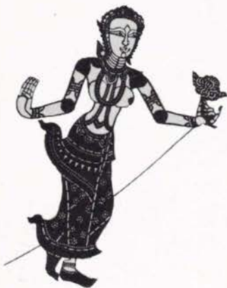
Scène de palais dans le Ayang