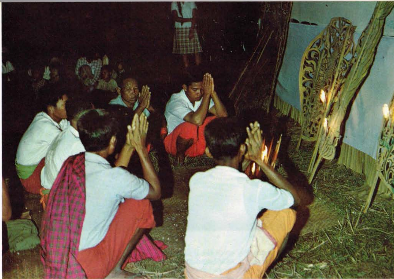
Cérémonie rituelle avant la représentation

ence par Vishnu, image de lacées au e petites ces peaux chef de la eux des e apparaît vacillante rasier, de aire très mais laisse ne demi- un cadre es dieux, stère. Et