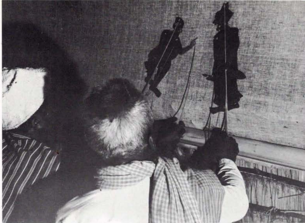
Les animateurs de Ayang